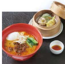
担々麺 (自家製点心付き) Tantanmen noodle (comes with dim sum)

単品 ¥1,950 Single item コーヒー付 ¥2,650 With coffee ケーキ・コーヒー付 ¥3,150 With cake and coffee