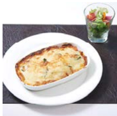
スパイシーシーフードドリア Spicy Seafood Doria

単品 ¥1,950 Single item コーヒー付 ¥2,650 With coffee ケーキ・コーヒー付 ¥3,150 With cake and coffee