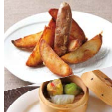
ケイジャンフライドポテト Cajun fried potato

単品 ¥1,250 Single item コーヒー付 ¥1,950 With coffee ケーキ・コーヒー付 ¥2,450 With cake and coffee