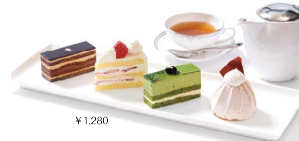
ケーキセット ¥1,280 Cake set

下記のケーキよりお選び下さい Please choose from the following cakes