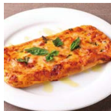
アッパーピザ (マルゲリータ) Upper Pizza (Margherita) トマトソース/トマト/バジル/モッツァレラ Tomato sauce / Tomato / Basil / Mozzarella

単品 ¥1,650 Single item コーヒー付 ¥2,350 With coffee ケーキ・コーヒー付 ¥2,850 With cake and coffee