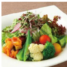
グリーンサラダ Green salad

単品 ¥1,650 Single item コーヒー付 ¥2,350 With coffee ケーキ・コーヒー付 ¥2,850 With cake and coffee