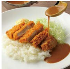
ふじのくに いきいきポーク カツカレー Curry with pork cutlet

単品 ¥1,950 Single item コーヒー付 ¥2,650 With coffee ケーキ・コーヒー付 ¥3,150 With cake and coffee