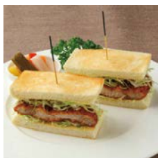
ふじのくに いきいきポーク カツサンド Pork cutlet sandwich

単品 ¥2,200 Single item コーヒー付 ¥2,800 With coffee ケーキ・コーヒー付 ¥3,300 With cake and coffee